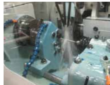
ねじ研削盤による高精度ねじ溝加工 High accurate shaft groove process by Grinding machine

Production procedures vary by accuracy requested from customers. Precision Ball Screws with high accuracy by Grinding process and Rolled Ball Screws with formed groove by Rolling dies(Tooling for Rolling process) can be classified. Generally, C5 or higher grade is manufactured by Grinding process and accuracy of C7, C10 are manufactured by Rolling process. It is also possible to produce C7, C10 by Grinding when Rolling dies do not exist.