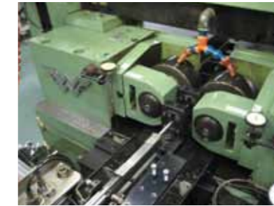
ロールダイスによる転造加工 Rolling process by Rolling dies